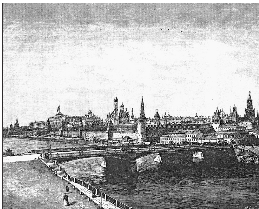
Вид Кремля с восточной стороны. Конец XIX века.

2 Автор вспоминает обычаи с середины 1920-х гг.