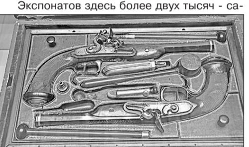
Экспонатов здесь более двух тысяч - са-

Много было трудностей на пути его создания. Положа руку на сердце: неизвестно, нашлось ли бы место для музея здесь, в самом сердце столицы, где каждый клочок земли немислимо дорог: чай, не бутки, не салон красоты и не ювелирная лавка... Нашли сами и не без остроумия. В годы заваленный строительным мусором и всяким хламом закрытый дворик - длинную и узкую щель между стенами бывшего Музея В. И. Ленина и строением на Никольской - вписали особой конструкции стеклянный двухэтажный павильон с экспозиционной площадью около 2000 кв. метров, буквально наштабированным самым современным музейным оборудованием. Музей снабжен мультимедийной информационной системой, включающей видеоролики ко всем разделам, атмосферные проекции, подборки анимационных и иллюстрированных карт основных военных кампаний 1805 - 1815 гг., интерактивные поля сражений. Есть также модель информационной навигации по экспозиции и тематической веб-ресурс, есть воспроизведения главных экспонатов с подробными аннотациями.