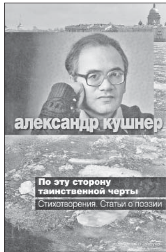
Быть нелюбимым! Боже мой! Какое счастье быть несчастным!

Идти под дождем домой С лицом потерянным и красным.