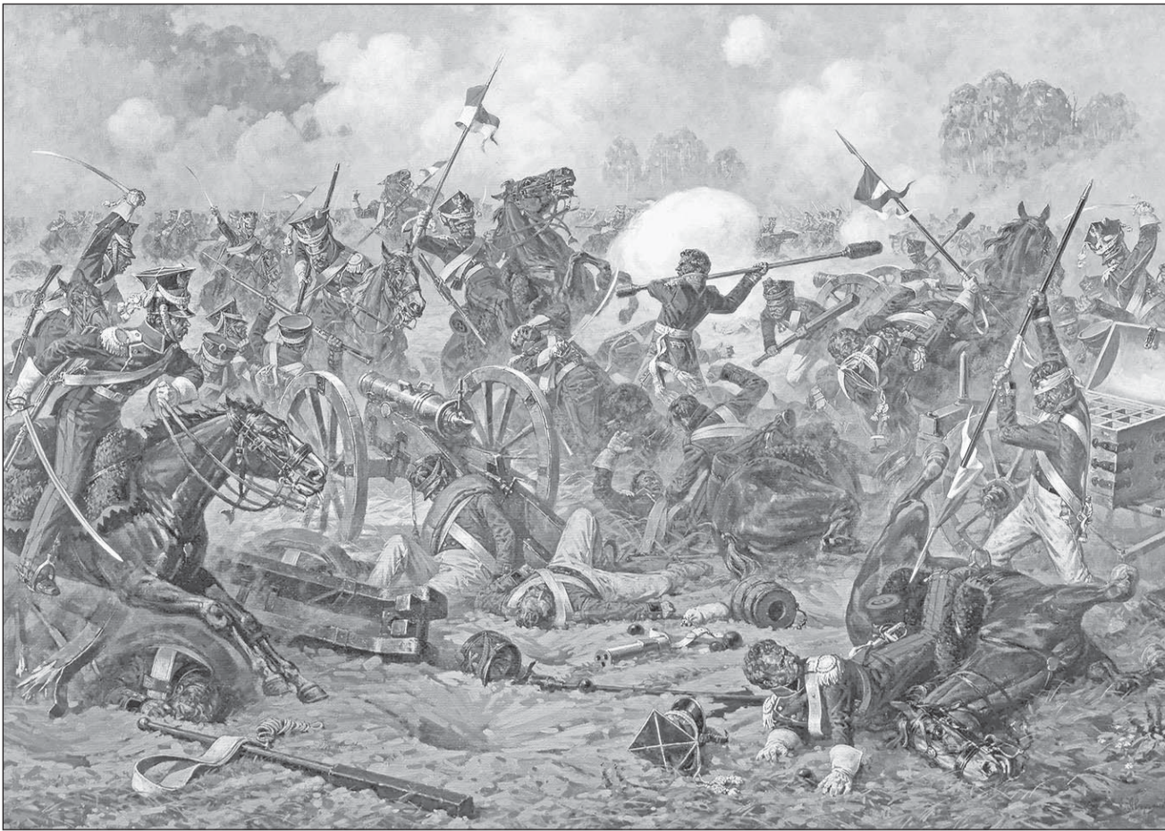
Начало на 1-й стр.

Судя по числу находок, самым напряженным было сражение на третьем поле. Сначала французская пехота мощной лавой, в несколько рядов, теснила русских. Но тут в бой вступила наша тяжелая кавалерия. Бой шел на одном 1 участке в полтора гектара. Это дало возможность нашим войскам переправиться через Черничку и занять позицию у деревни Винково, теперь она носит название Чернишка. Французы потеряли 800 человек убитыми, тысячу ранеными и вынуждены были признать победу русских. Никакие усилия Мюрата не смогли заставить русские войска изменить позицию. Они твердо держали рубеж до 18 октября. А Кутузов 7 октября писал жене: «Бог мне даровал победу вчера при Чернишке; командовал король Неополитанский. Были они от сорока пяти - до 50 тысяч. Немудрено их было разбить, но надобно было разбить дешево для нас, и мы потеряли всего, с ранеными, только до трехсот человек. Первый раз французы потеряли столько пушек и первый раз бежали, как зайцы». А через 130 лет на этом историческом рубеже уже более кровавые бои шли в октябре - декабре 1941 года. На рубеже Нары, на дальних подступах к Москве был прегражден