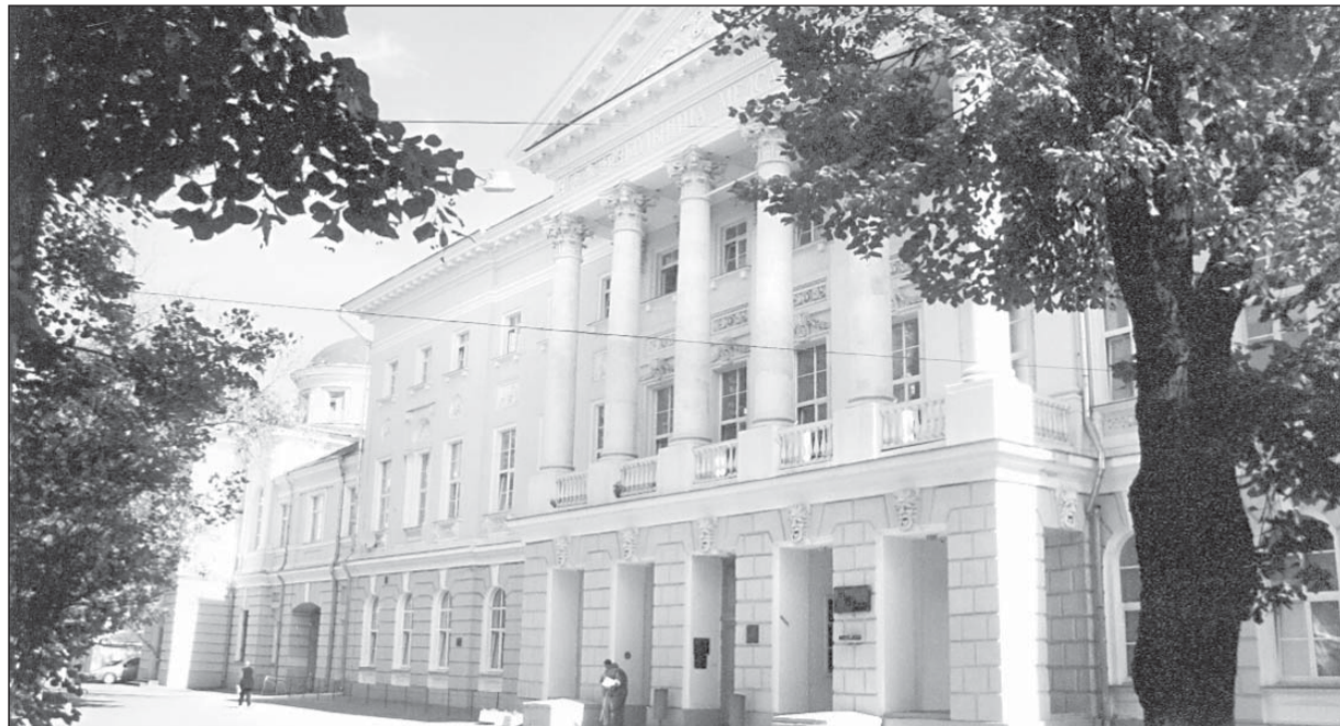
Главный дом усадьбы Баташева на Швивой горке.