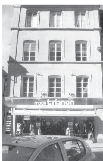
Дом, в котором родился Антан Анри Жомини.

Окончание. Начало в «МП» за 21 сентября, 4 и 10 октября.