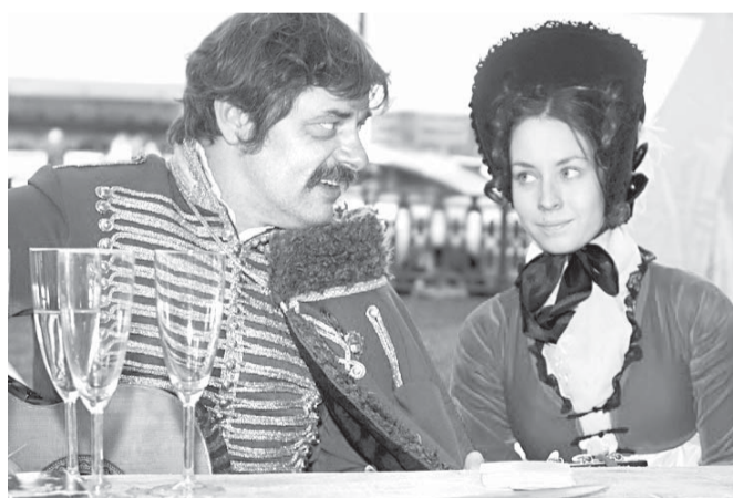
«О, как, мне кажется, могли вы/ Руюю, полною перстней, / И кудри дев ласкать - и гривы/ своих коней!» (М. Цветаева «Генералам Двенадцатого года»).