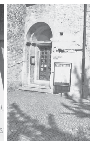
Вход в городской музей.