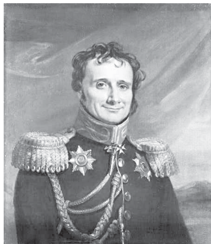
Портрет Антуана Анри Жомини в Военной галерее Зимнего дворца.