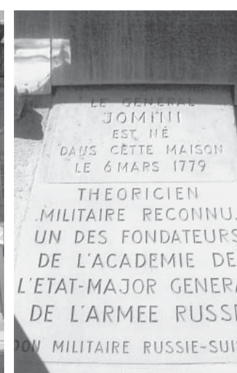
Памятная доска на доме, где родился Антан Анри Жомини.