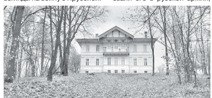
Усадьба Н. Г. Жомини в Нижегородской области.

Свою трудовую жизнь Антан Анри начал клерком в Париже. Во время революционных войн стал командиром батальона. В мирное время вернулся в коммерцию, но, занимаясь в одной из парижских коммерческих контор, изучил военные науки и уже в 1804 году издал сочинение, содержащее сравнительное исследование кампаний Фридриха Великого и генерала Бонапарта. В 1804-м Жомини вступил волонтером в ряды французской армии. Прочтав его труд, Наполеон присвоил Антану Анри звание полковника. В 1806 году Жомини издал новое сочинение, в котором изложил свои взгляды на войну с Пруссией.