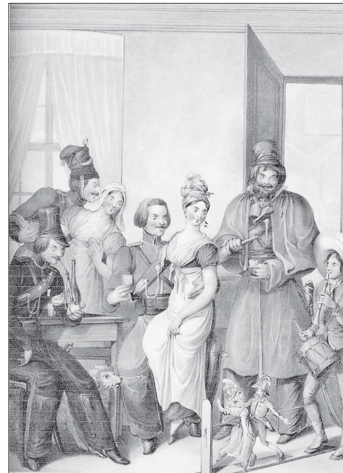
Кукольное представление в кафе.