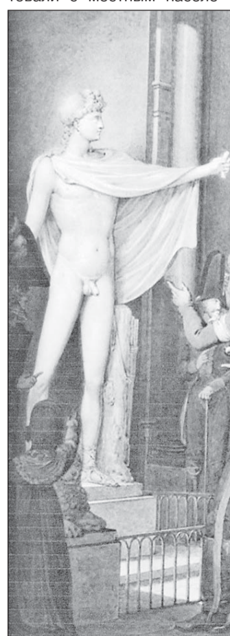
У статуи Аполлона в музее.

дерматта экскурсоводы непременно подчеркивали, что русские войска не просто выполняли освободительную миссию на швейцарской земле, но и вели себя дисциплинированно, не конфликтовали с местным населением.