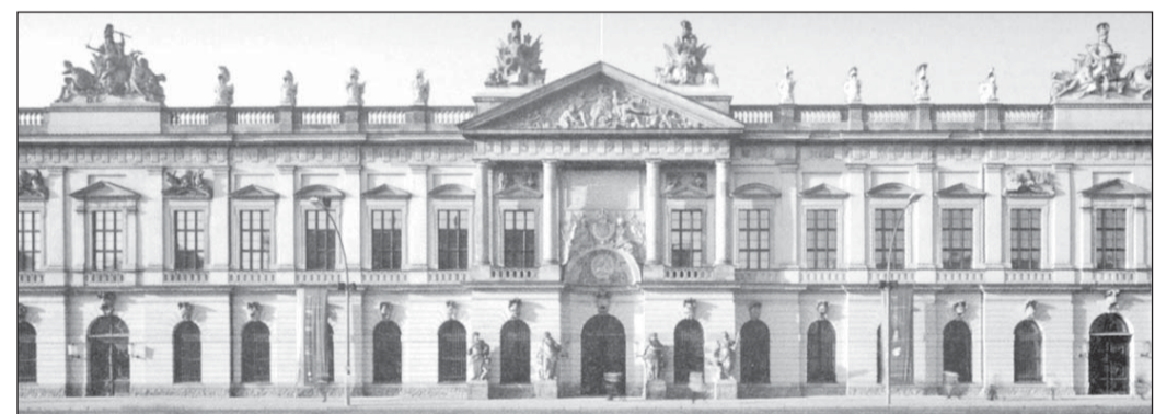
Немецкий исторический музей.