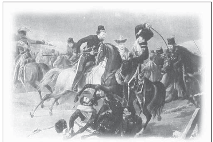
Битва при селе Ляхово.