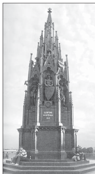
Национальный памятник в честь победы над Наполеоном.

Королева Луиза Пруская, супруга Фридриха Вильгельма III, пользовалась большой любовью своих подданных, а после ее смерти вокруг ее имени сложились немало легенд. Простую и скромную королеву считали образцом жены и матери и настоящей прусской патриоткой. Известно, что Наполеон именно ее считал виновницей войны 1806 года, которая закончилась молниеносным разгромом