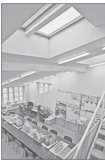
Справа от главного здания МАРХИ находится так называемый Кузнецовский корпус, имеющий по-своему замечательную историю. Он

ронцовых: им когда-то принадлежал огромный сад, спускавшийся террасами к реке Неглинке. В здании в разные годы размещались: медико-хирургическая академия, клиники медицинского факультета Московского университета, Строгановское художественно-промышленное училище, архитектурное отделение ВХУТЕМАСа и в последние 80 лет - архитектурный институт.